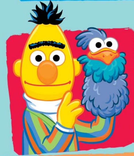
المسرح (فن الدمى) Performing a puppet show