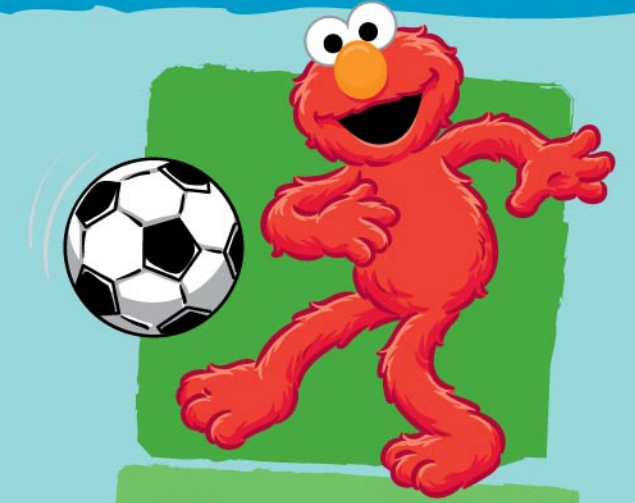
لعب الرياضة Playing sports