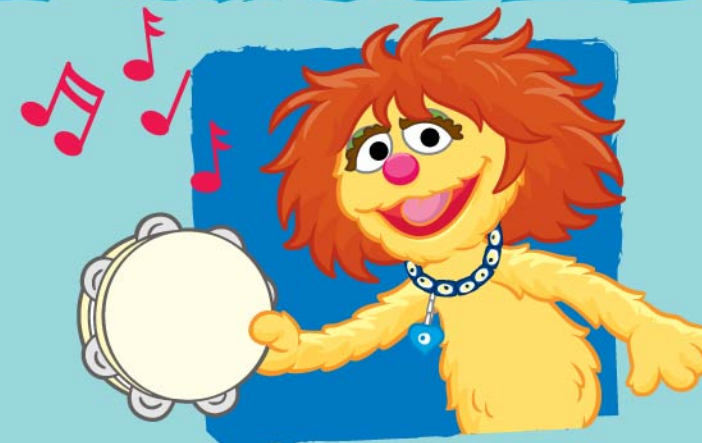
العزف على آلة موسيقية Playing a musical instrument